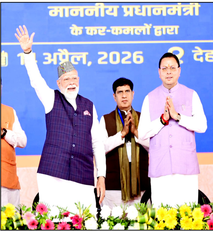
देहरादून। प्रधानमंत्री नरेंद्र मोदी ने मंगलवार को जसवंत सिंह आर्मी ग्राउंड,

गढ़ी कैंट में आयोजित समारोह में 210 किमी लंबे, दिल्ली-देहरादून इकोनॉमिक कॉरिडोर का रिमोट बटन दबाकर लोकार्पण किया। इससे पहले प्रधानमंत्री ने गढ़ी कैंट तक 12 किलोमीटर लंबे रोड शो में प्रतिभाग करने के साथ ही डाटकाली मंदिर में दर्शन करने के उपरांत पूजा भी की।