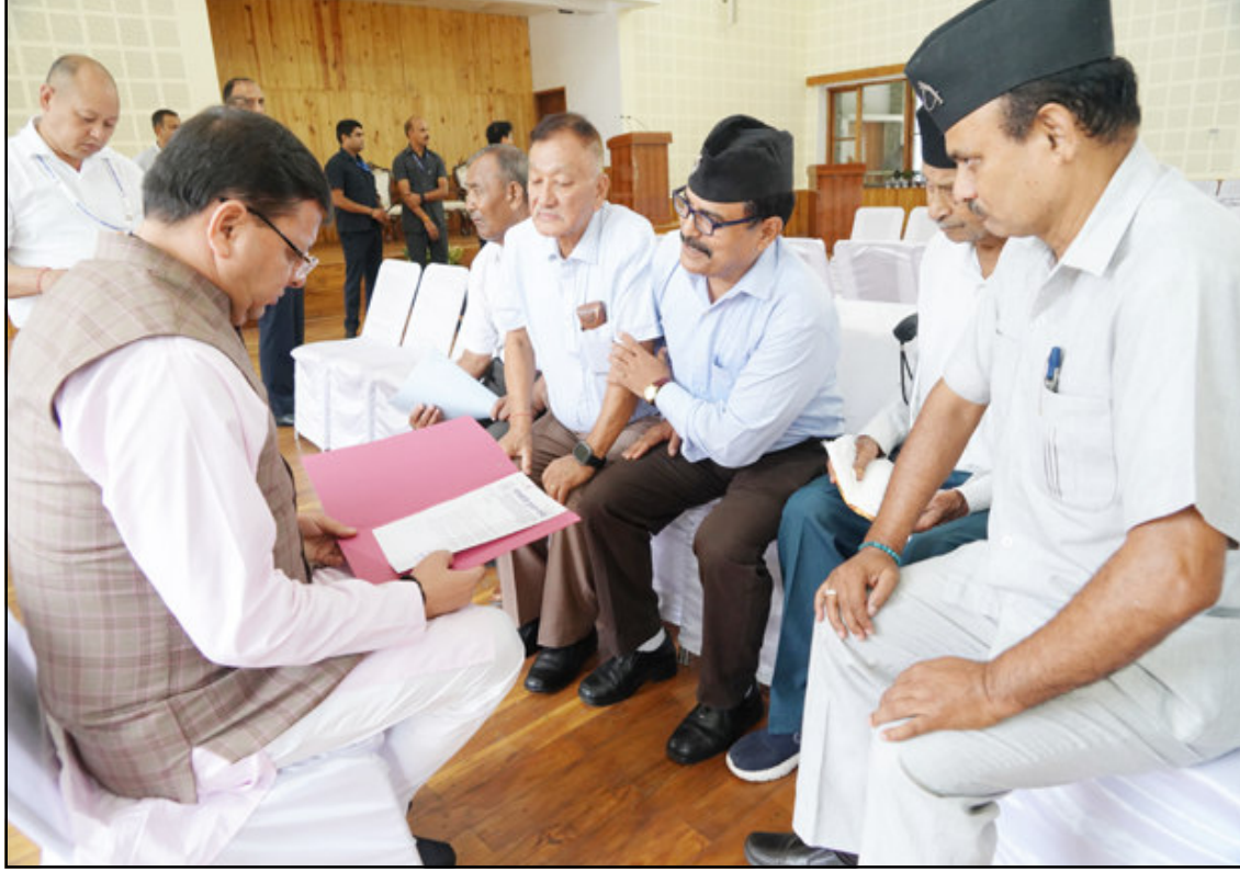
मुख्यमंत्री के समक्ष विभिन्न क्षेत्रों से आये लोगों ने सड़क, बिजली, पेयजल, स्वास्थ्य, आर्थिक सहायता एवं अपने क्षेत्रों की विभिन्न

देहरादून (संवाददाता)। मुख्यमंत्री पुष्कर सिंह धामी ने रविवार को मुख्यमंत्री आवास स्थित मुख्य सेवक सदन में प्रदेश के विभिन्न क्षेत्रों से आये लोगों की शिकायतों और समस्याओं को सुना। मुख्यमंत्री ने जन समस्याओं के त्वरित समाधान के लिये अधिकारियों को निर्देश दिये। उन्होंने निर्देश दिये कि जो भी जन समस्याएं आ रही हैं, उनका समयबद्धता से निस्तारण किया जाए। मुख्यमंत्री ने अधिकांश जन समस्याओं और शिकायतों का मौके पर निस्तारण किया। कुछ जन समस्याओं को संबंधित विभागों को कार्यवाही करने के निर्देश मुख्यमंत्री ने दिये हैं। जन समस्याओं का यथाशीघ्र समाधान के लिए विभिन्न विभागों को भेजे गये पत्रों पर क्या कारवाई हुई, इसकी मुख्यमंत्री कार्यालय द्वारा मॉनिटरिंग की जाती है। मुख्यमंत्री ने कहा कि जन समस्याओं का त्वरित समाधान करना सरकार की प्राथमिकता है। अधिकारियों को स्पष्ट निर्देश दिये गये हैं कि जनहित के कार्यों को प्राथमिकता में रखा जाए।